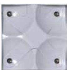
スタンダードカートリッジ