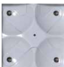
ジェットクロスチャンネル カートリッジ(標準)